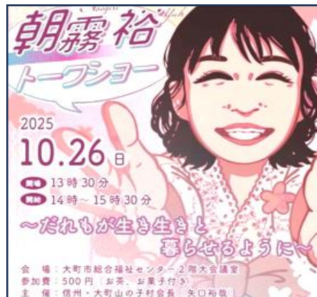
トークショーで一矢さんを紹介してくれました