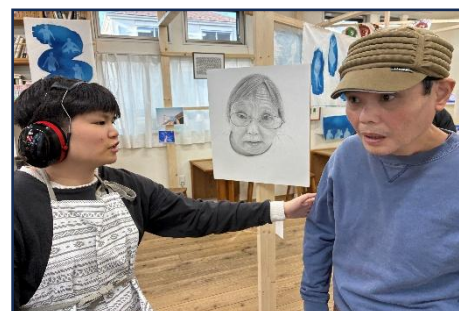
ひーやんとカプカプ川和にて

の本」が出版されました。クラウドファンディングで皆さんの協力をお願いし、ようやく形